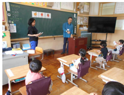
外国語学習「フルーツを英語で」 大きな声で発音しました。