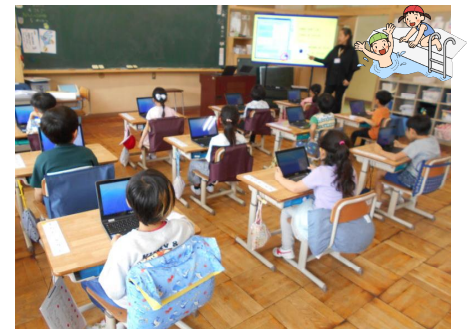
ICT指導員の先生から 文字入力を学びました。