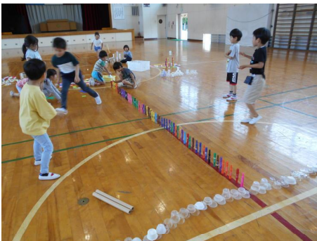
算数「ならべてみつけて」 体育館に並べました。

今月は、子どもたちが楽しみにしている水泳学習が始まります。少ない学習の機会ですので(全5回)、体調不良や忘れ物で参加できないのはとても残念です。健康管理と水泳用具の準備については、ご協力をお願いいたします。暑い日が続くようになってきますが、元気に頑張っていきたいと思います。