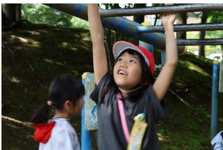
うんていにもチャレンジ！