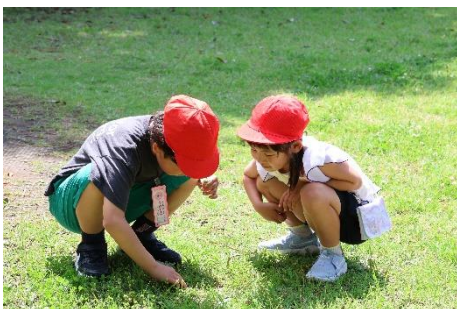
なにがあるのかな？