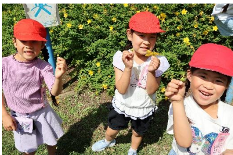
ぴくみんなみたいな花～！！