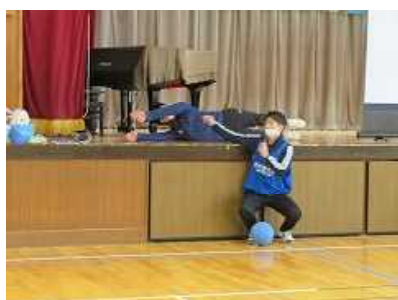
ゴールボール体験