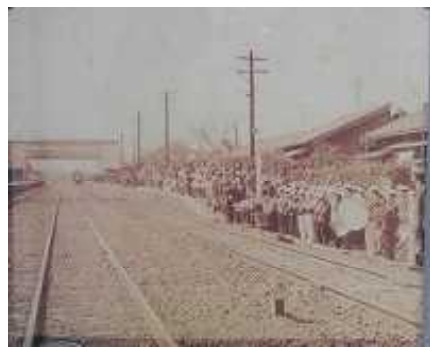
※保健室前の寄贈写真より

そして今年、木下小学校で成田線開通120周年に子ども達と一緒に参加することができ、とてもうれしく思います。