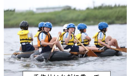
手作りいかだに乗って

コロナ禍をきっかけに一人一台端末(タブレット)の整備が急速に進み、外に出なくてもあらゆる情報が手指の操作で簡単に手に入るようになりました。コロナ禍では最適な学習方法の一つでしたが、モニターに映る写真や動画では、質感、奥行き、色合いの変化や音の微妙な揺れ等を感じることに、どうしても限界が生じます。大人は今までの生活経験や知識から想像し、大体を掴むことが可能ですが、それでも本物にはかないません。ましてや、まだ6年～12年しか生きていない生活経験の浅い小学生です。頭も心も柔らかいうちに本物に出会い、人と関わり、自らの目や耳、手、体全体で感じ、感じたことを自らの言葉で表現する。本物との出会いや人との関わりが、確かな知識理解、豊かな感性を育てていくと考えます。