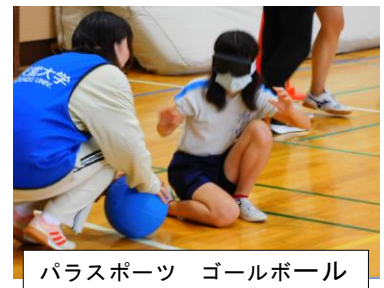
パラスポーツ ゴールボール

6月は外部講師をお招きした体験活動がありました。6年生「邦楽体験」、4年生「パラスポーツ体験」「お雛子体験」、1年生「ザリガ二つり」。そして、5年生は今年も小見川少年自然の家で自然教室(宿泊体験)を行い、キャンプファイヤーや「いかだ作り」を体験しました。子ども達の様子を見て強く感じたのは、体験学習の大切さです。