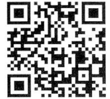
連絡メール2 保護者登録