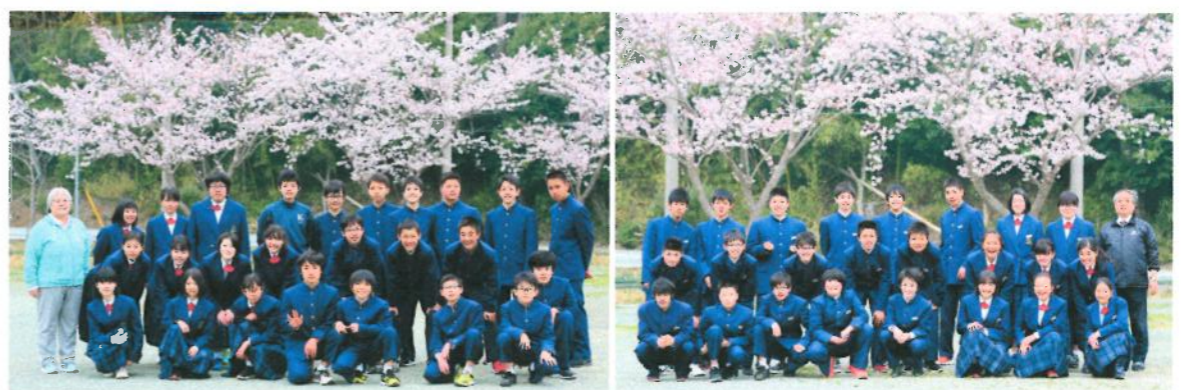
進級直後の桜の季節。あれから1年たちました。