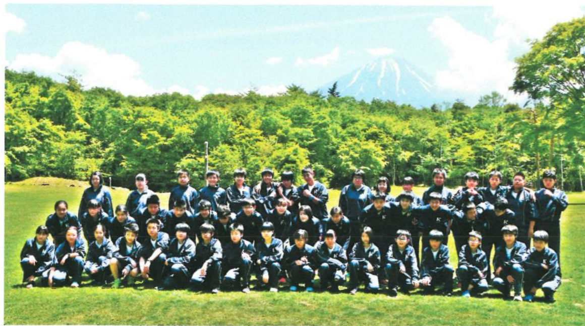
◇富士山を望む西湖まで、元気に自然教室に行ってきました。