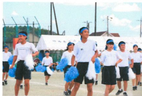
9月の体育祭では、競技も応援も精一杯がんばりました。