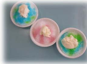
その他、いろいろな活動を行っています。