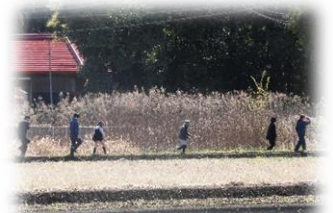
フィールドワーク