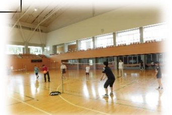
チャレンジスポーツ