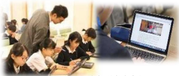
文部科学省資料より