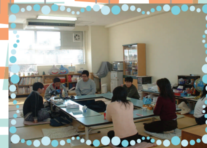
(畳の部屋で、楽しくおしゃべり)