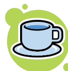
(調理実習・喫茶室)