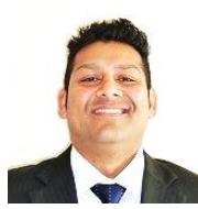
A L T シュミット チャンドラ