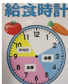
(一目でわかるように)