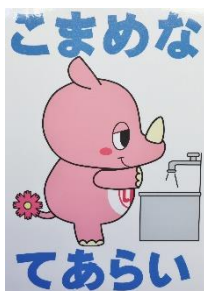
(絵を使ってわかりやすく)